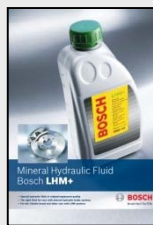
Brošura 1 987 XXX XXX