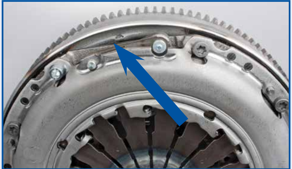
Slika 1: Trošenje materijala uzrokovano korišćenjem predugačkog vijka

Ukoliko su dostavljeni novi vijci za pričvršćivanje prilikom zamene kvačila ili zamajca sa dvostrukom masom, obavezno treba koristiti ove vijke. Ukoliko vijci nisu dostavljeni, mogu se koristiti samo vijci M6x13 iz kategorije jačine 10.9.